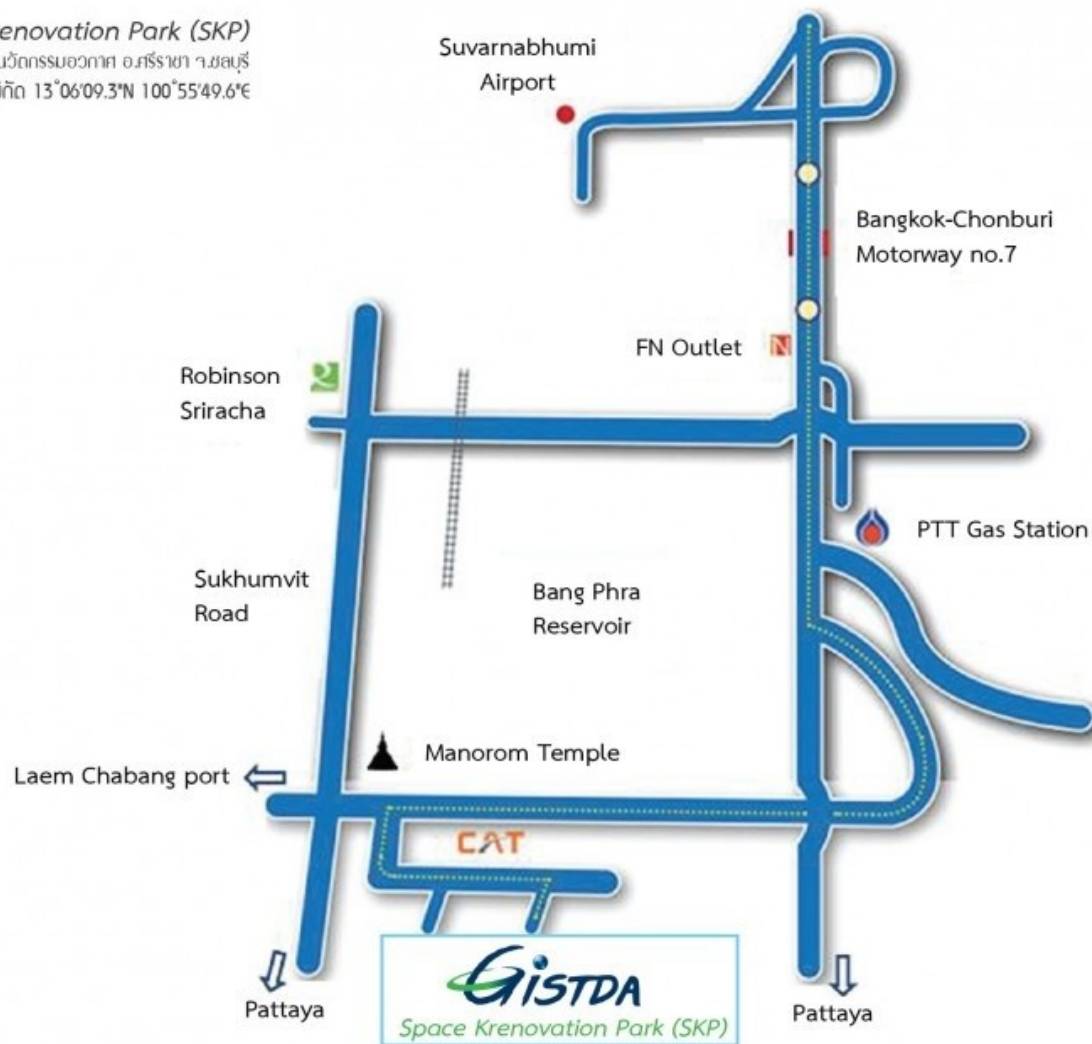
แผนที่ อุทยานรังสรรค์นวัตกรรมอวกาศ Space Krenovation Park (SKP) สทอภ. ศรีราชา

Space Krenovation Park (SKP) อุทยานรังสรรค์นวัตกรรมอวกาศ อ.ศรีราชา จ.ชลบุรี ค่าพิกัด 13°06'09.3"N 100°55'49.6"E