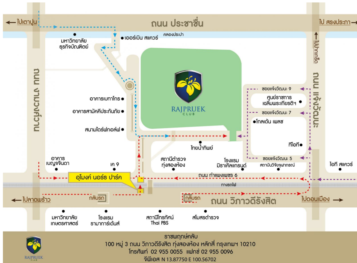
แผนที่ อาคารสปอร์ตคลับเข้าสู่ ราชพฤกษ์ คลับ ถนนวิภาวดี-รังสิต แขวงทุ่งสองห้อง เขตหลักสี่ กรุงเทพมหานคร